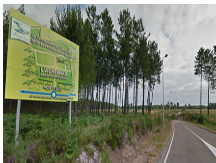
ZONE D'ACTIVITES ACHERNAR