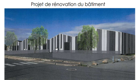
Projet de rénovation du bâtiment